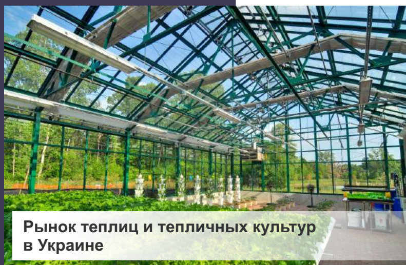
Рынок теплиц и тепличных культур в Украине