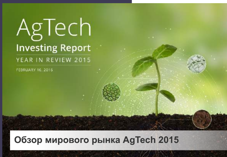
Обзор мирового рынка AgTech 2015