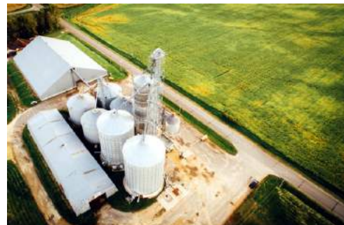
Агрокомплекс полного цикла со специализацией свиноводство