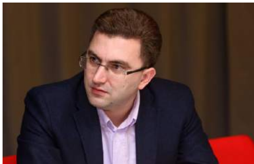
С деньгами на выход или опыт успешного exit'a