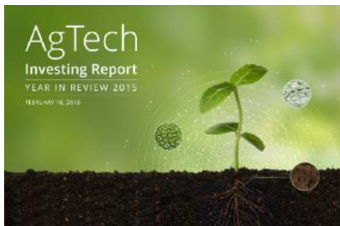
Обзор мирового рынка AgTech 2015