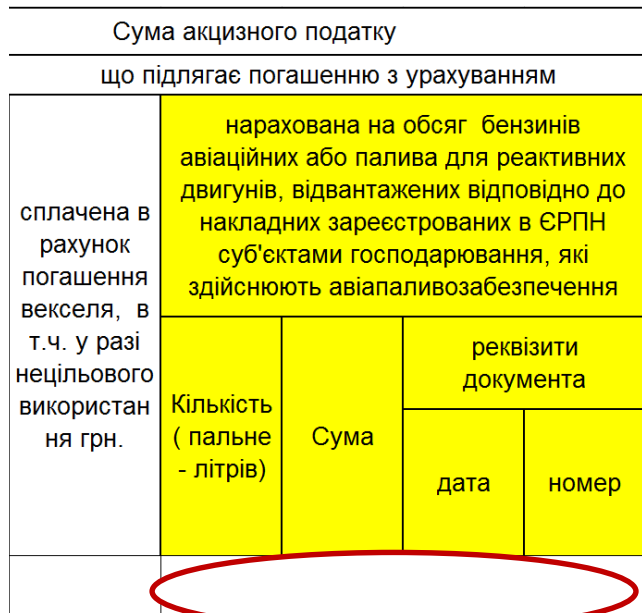
Інтерфейс «Акцизна накладна»